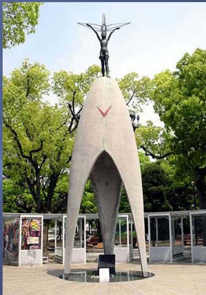
ПАМЯТНИК САДАКО САСАКИ В ХИРОСИМЕ

Японская легенда гласит: тот, кто сложит 1000 бумажных журавликов, в награду получит исполнение желания. 25 октября 1955 года из рук Садако Сасаки выпал 644 журавлик, девочка умерла.