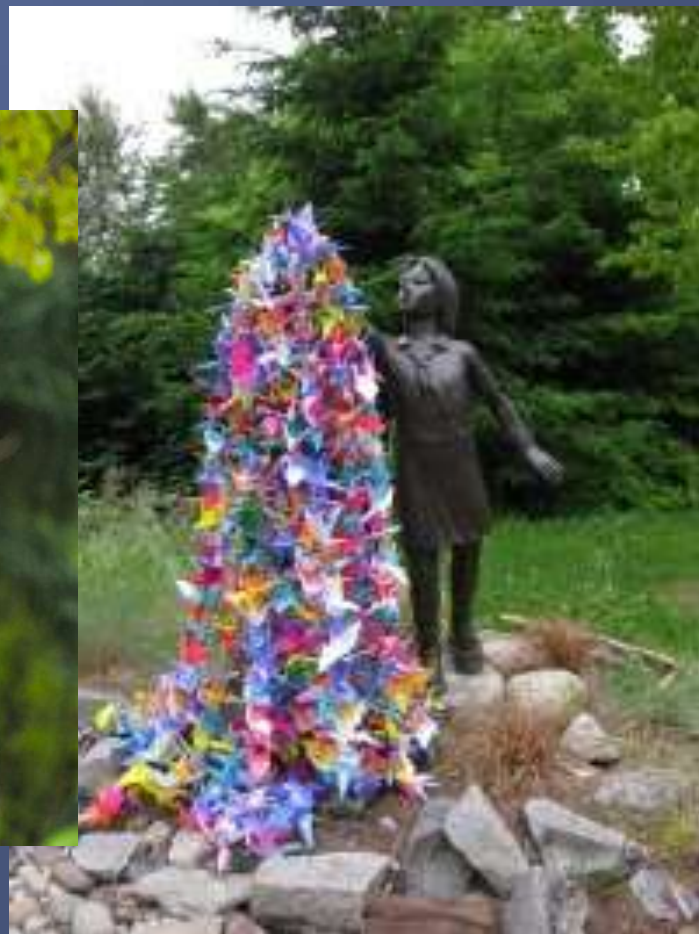
ПАМЯТНИК САДАКО САСАКИ В СИЭТЛЕ