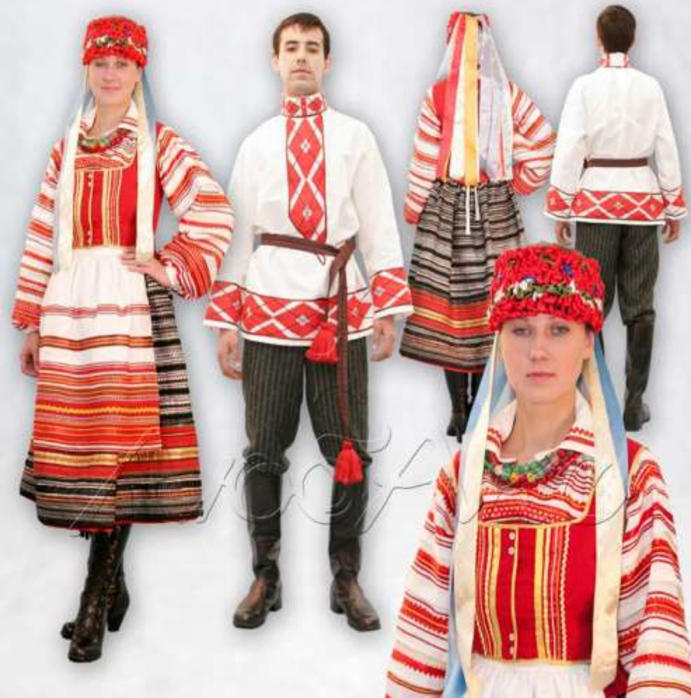
БЕЛОРУССКИЕ МУЖСКОЙ И ЖЕНСКИЙ КОСТЮМЫ. Конец XIX в.

Народные костюмы белорусок невероятно красивы. Яркие, контрастные расцветки, многообразие отделочных элементов, богато украшенных национальными узорами — характерные черты традиционной женской одежды. Женщины умели ткать, шить, вышивать, плести кружева. Материалы делали из волокон льна, конопли.